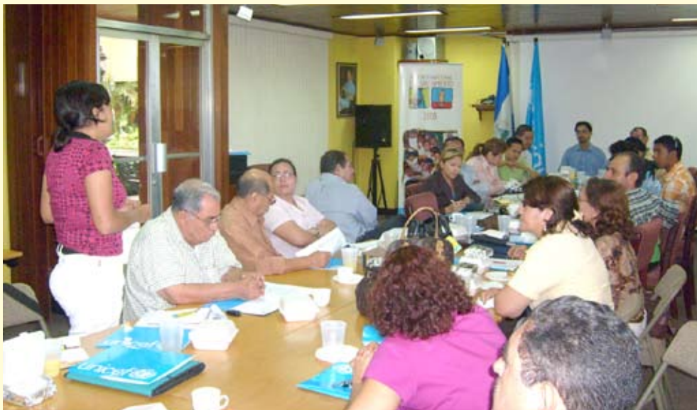
Desayuno con periodistas.